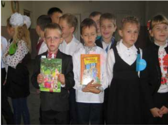
Презентація збірки Василя Сухомлинського «Квітка сонця»